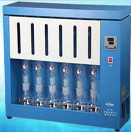
Soxhelet i Kjeldahl