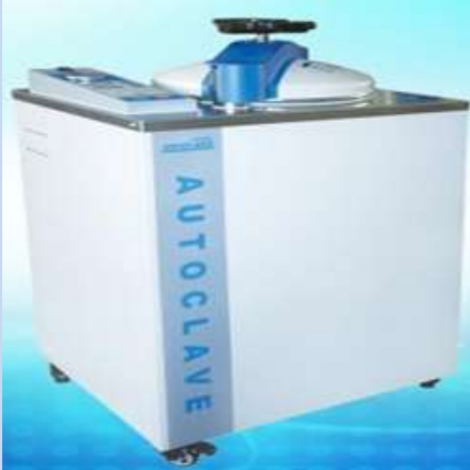
Autoklavi vertikalni, portabl